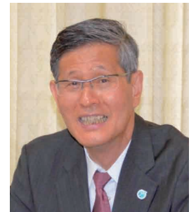
認定 NPO 全世代代表理事 尾身茂

新型コロナワクチンを接種する医師が不足している地域と先生のキャリアを繋ぐ事業です。是非ご登録ください。